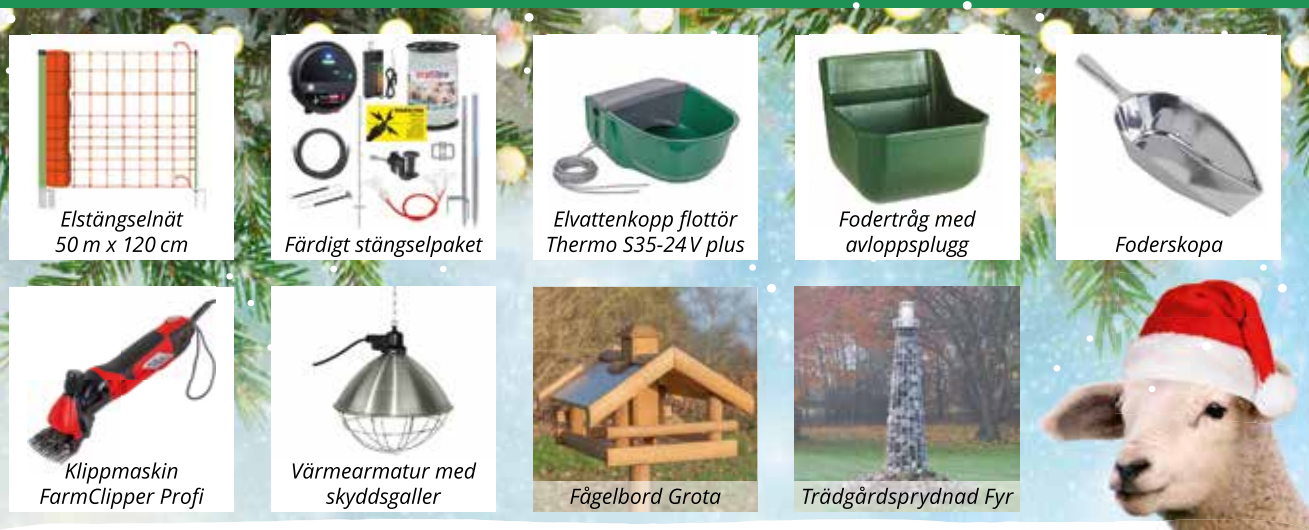
Elstängselnät 50 m x 120 cm

Brett utbud av stängseltillbehör & produkter för gård, stall och trädgård