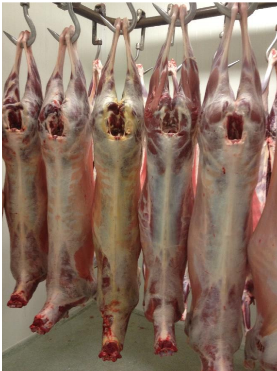
Mitt i bilden ses ett gulfärgat lamm.

-Gulfärgning av fett förekommer hos vissa gutefår. Detta är inte gulsot utan en inlagring av karotenoider pga en oförmåga att bryta ner dessa. Denna oförmåga är genetisk och därmed ärftlig. Karotenoider är ett pigment från växtriket som finns i gräset. Karotenoider är helt ofarliga och tillsätts tex i hönsfoder för att få gula äggulor. Otjänligförklarande av lamm beror troligen på att vissa veterinärer tolkar gulfärgningen som gulsot. Andra menar att färgen i sig är tillräckligt för att otjänligförklara pga avvikande utseende. Det är olyckligt att det inte finns en enhetlig bedömning mellan veterinärerna.